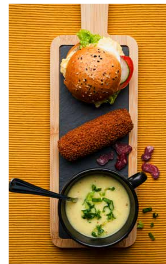
▲ Een twaalf-uurtje biedt alles in één.

De specifieke mogelijkheden en arrangementen zijn te vinden in de tarieflijst achterin deze brochure.